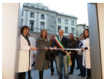
Il taglio del nastro

L'intervento ha permesso di dotare la farmacia di ulteriori 55 mq di superficie e di potenziare i servizi offerti