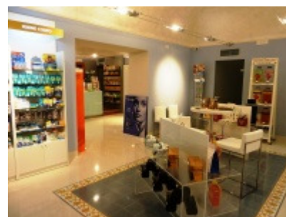
I nuovi locali della Farmacia comunale

restyling dei locali ed aprendo una seconda farmacia comunale nella parte nuova di Umbertide ed oggi, nonostante la difficoltà nel reperire le risorse, abbiamo ritenuto opportuno investire di nuovo nelle farmacie, in quanto presidi della salute pubblica. Secondo la normativa, ad Umbertide potrà aprire una nuova farmacia, di natura però privata, e come Comune non potevamo non potenziare l'offerta della farmacia di piazza Matteotti che, come anche per quella di via del Vignola, ha sempre prodotto utili, e questo è un fatto non sempre scontato. Oggi le farmacie non vendono solo medicinali, ma anche tanti altri prodotti e servizi e grazie a questo ampliamento potremo arricchire l'offerta ai nostri cittadini”.