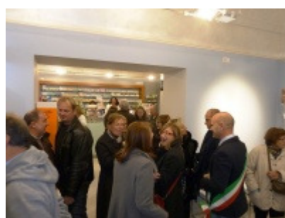
Visita alla nuova Farmacia

“In un periodo di tagli e di razionalizzazioni la nostra scelta è stata quella di potenziare un servizio pubblico, come è quello offerto dalla farmacia comunale di piazza Matteotti, e al contempo, di valorizzare il centro storico – ha dichiarato il sindaco Giulietti - a questo proposito nei prossimi giorni partiranno i lavori per la realizzazione della nuova