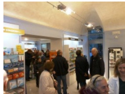
Visita ai nuovi locali